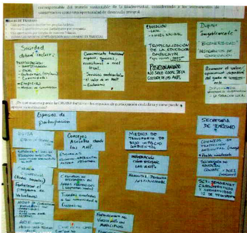
Ejemplo de mampara con aportaciones de los participantes sobre la Visión y los aspectos que facilitarán su cumplimiento.