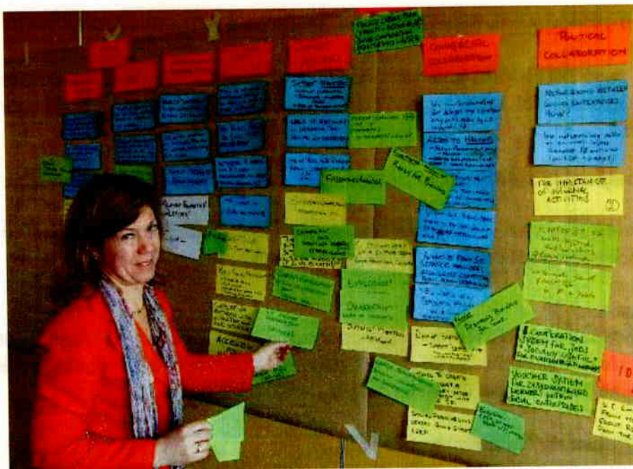
Se muestra una mampara explicada por uno de los moderadores.