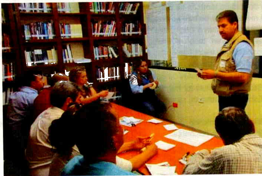
Mesa de trabajo, se muestra al moderador con los participantes.